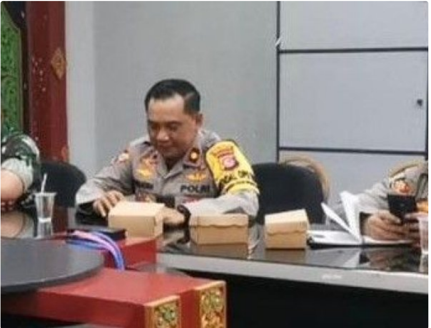
Kabagops Polresta Mataram saat menghadiri Rakor di Kantor Bupati Lombok Barat, Selasa (10/12/2024)

MATARAM, NTB – Dua tradisi budaya ikonik, Pujawali dan Perang Ketupat, akan kembali digelar di Pura Lingsar, Kecamatan Lingsar, Kabupaten Lombok Barat. Persiapan event tahunan ini kian dimatangkan oleh Pemerintah Kabupaten